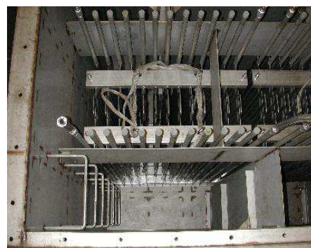
● タンク内プレートコイル設置状況